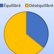
Fig2: Répartition des patients selon l'équilibre du diabète